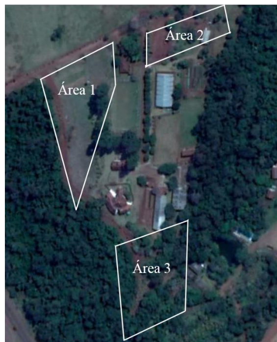
Figura 1. Áreas dos sistemas agroflorestais implantados na APAE Rural de Campo Mourão, Paraná, Brasil.

A área de estudo na APAE RURAL de Campo Mourão abrange aproximadamente 1,2 ha, sendo divididas em três áreas menores escolhidas especificamente para a realização da pesquisa: a) Área 1, tem 6.067 m 2 está em “recuperação inicial” apresenta-se dominada por gramíneas e ainda em fase de planejamento; b) Área 2, tem cerca de 3.622 m 2 e está em fase de “recuperação intermediária”, a qual recebeu um sistema agroflorestal baseado na fruticultura e algumas culturas temporárias como forma de enriquecer o solo; c) Área 3, tem cerca 2.247 m 2 e encontra-se em “recuperação avançada”, a qual abrange uma área de preservação permanente que margeia um córrego, o sistema utilizado foi o sucessional biodiverso, sendo ele o sistema que mais se assemelha a uma floresta primária (Figura 1).